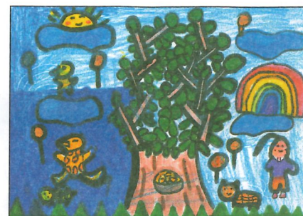
彰化縣 大榮國小 二年甲班 黃郁綺