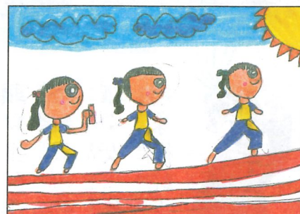
彰化縣 大榮國小 二年乙班 趙詩涵