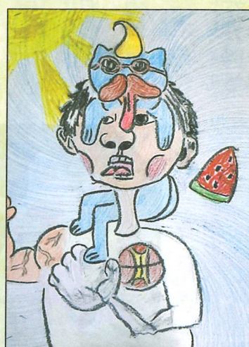
臺中市 大智國小 三年6班 鄒侑昇