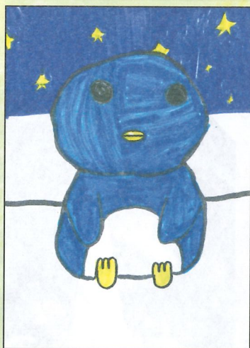
臺南市 下營國小 三年乙班 姜宇婕