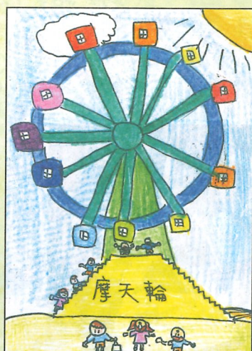
臺南市 小新國小 六年1班 毛宸琪