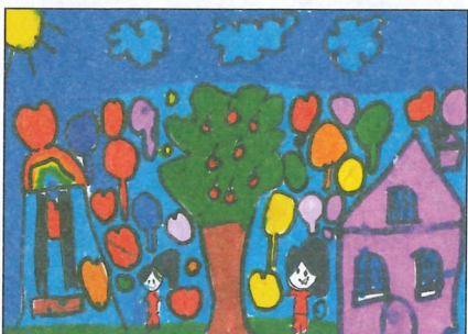
彰化縣 大榮國小 二年甲班 許璽恩