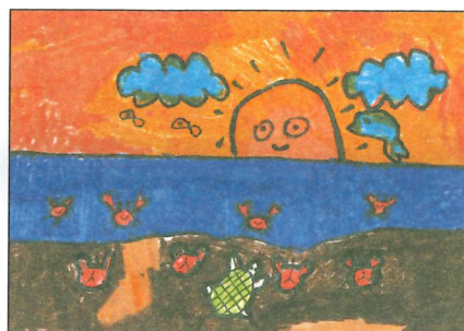
彰化縣 大榮國小 二年甲班 葉孟杰