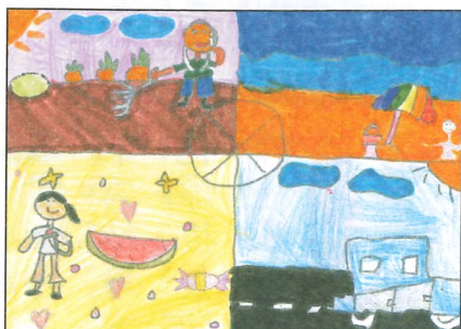
彰化縣 大同國小 三年丙班 陳炫芮